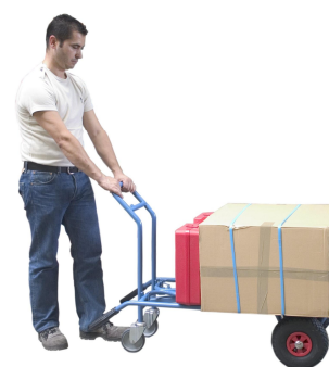
Position 3 Version chariot CU 350 kg Roulettes pivotantes à l'arrière