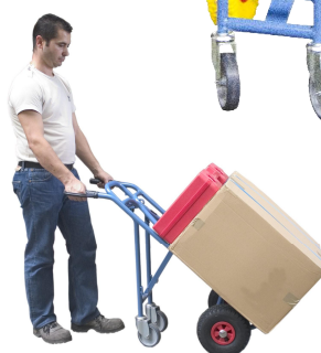
Position 2 Tablier incliné pour un bon maintien de la charge, béquille équipée de roulettes pivotantes Ø 125 mm pour une grande manoeuvrabilité