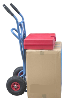
Position 1 Diable tablier droit

Existe en version roues increvables. Limite la charge à 150 kg. Poids : 16 kg